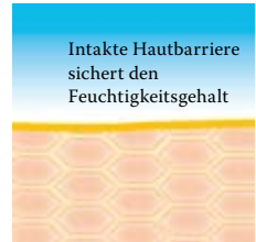
Intakte, schützende Hautbarriere mit Linol-säure-reichen Lipiden.

Besuchen Sie uns unter www.linola.de . Denn dort haben wir für Sie alle aktuellen Informationen über Linola Hautmilch , Linola Gesicht , Linola Hand und Linola Fuß-Milch sowie zu weiteren Linola-Produkten bei verschiedenen Hautproblemen bereitgestellt.