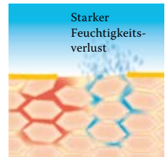
Lipidverlust führt zu einer gestörten Hautbarriere: Die Haut verliert viel Wasser und trocknet aus.